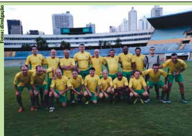
TCE e Amigos X Magistrados e Amigos, em animado amistoso no Estádio Serra Dourada